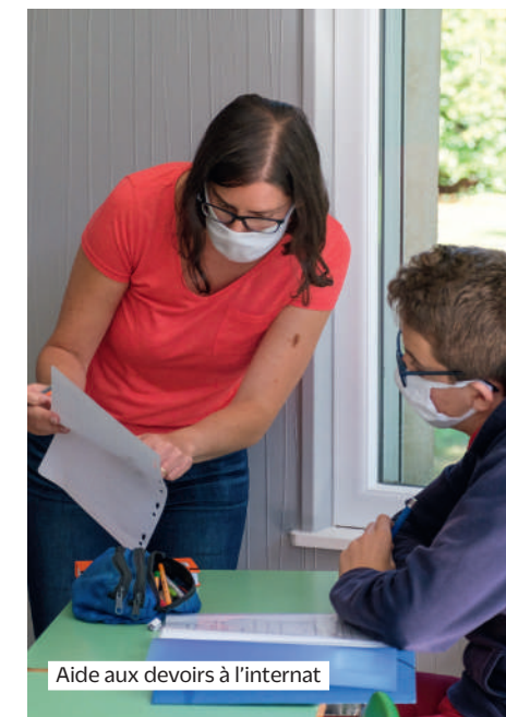
Aide aux devoirs à l'internat