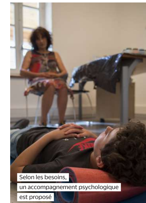
Selon les besoins, un accompagnement psychologique est proposé